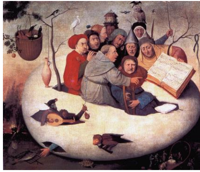
André GABY (org.). Mirabilia Journal 33 (2021/2)

Music in Antiquity, Middle Ages & Renaissance – Música a l'Antiguitat, l'Edat Mitjana i Renaixement – La Música en la Antigüedad, Edad Media y Renacimiento – A Música na Antiguidade, Idade Média e Renascimento