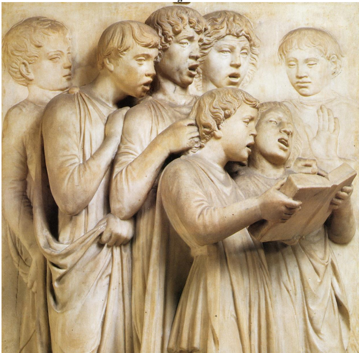
Meninos cantores. Detalhe da obra “Cantoria di Luca della Robbia”, esculpida no coro da Catedral de Santa Maria del Fiore , em Florença e hoje preservada no Museo dell’Opera del Duomo .

A procura de cantores com vozes agudas para realizar a voz do soprano, foi uma tônica geral nas catedrais espanholas. Nos registros de várias igrejas encontramos relatos da dificuldade em se encontrar bons tiples . No caso específico das Catedrais menos abastadas, como a de Zamora, que não contava com um grande recurso econômico, a dificuldade era ainda maior.