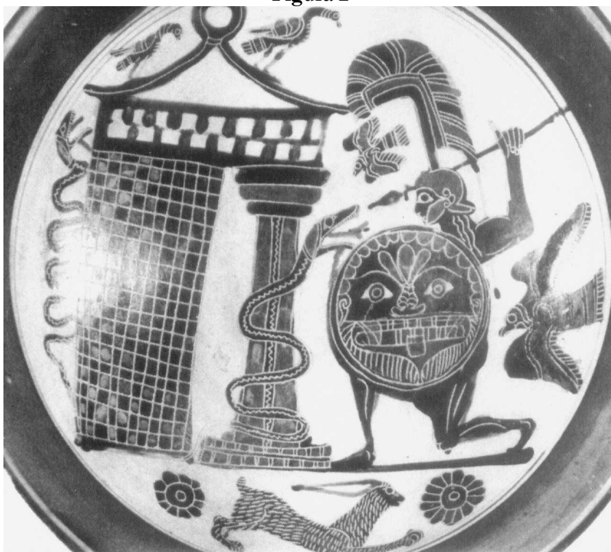
Louvre E 669

O fato de Apolo aparecer pintado como um guerreiro hóplita, mais uma vez indica a associação que os pintores faziam dos deuses com a elite espartana. Os atributos do herói eram o arco e a flecha, que jamais aparecem na iconografia em vasos. Essas armas eram desprezadas pelos espartanos, que as consideravam armas de covardes. Por isso mesmo, a elaboração da estátua de Apolo, em Amyclai, financiada pelo próprio Estado espartano, foi elaborada com o herói vestido como um hóplita. Os vasos, elaborados entre 550-540, e a estátua, em 530, mostram, entre outras coisas, a acentuação da preocupação com a guerra que vai se dando naquele período.