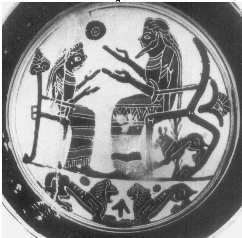
Munique, Museum Antiker Kleinkunst 384