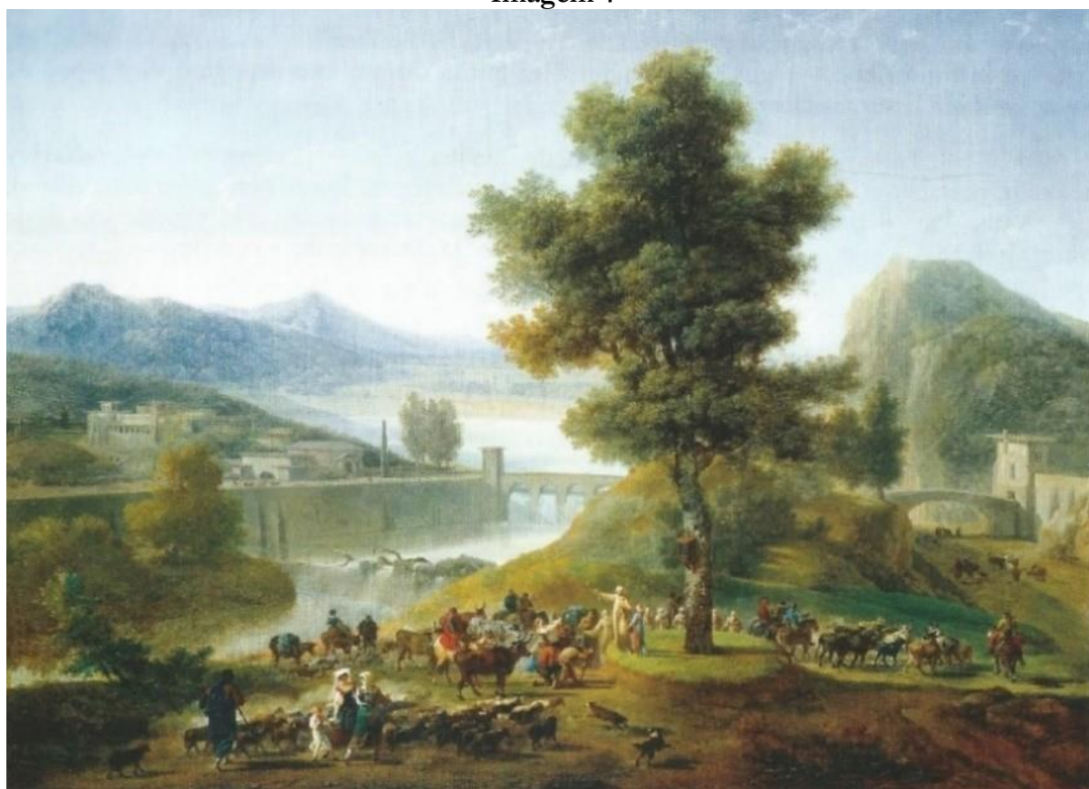
Nicolas-Antoine Taunay. Bénédictio des troupeaux à Rome [Bênção dos rebanhos em Roma], 61 x 81 cm, óleo sobre tela, 1787. Museu de Belas Artes de Nancy - França. In: LEBRUN JOUVE, Claudine. Nicolas-Antoine Taunay, op. cit. , pp. 77, 155.