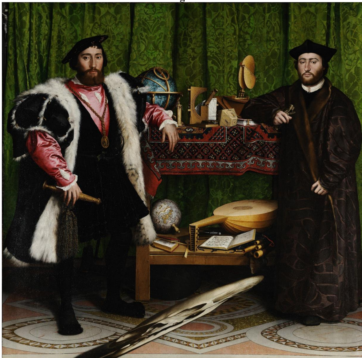
Os embaixadores (1433) de Hans Holbein, o Jovem (1497-1543). Óleo sobre carvalho, 207 x 209,5 cm, National Gallery, Londres.

Associados, os objetos remetem aos saberes do trivium e do quadrivium , relacionando-se com os dois personagens centrais da imagem: os embaixadores franceses Jean de Dinteville, à esquerda, e Georges de Selve, à direita. Deste modo, a pintura de Holbein constrói a imagem de homens da diplomacia de inícios do século XVI que