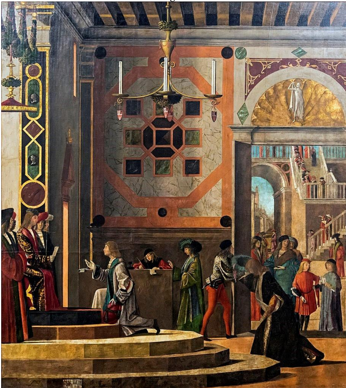
A partida dos embaixadores ingleses (c. 1495-1500), de Vittore Carpaccio (1465-1526). Óleo sobre tela, 280 x 253 cm, Campo della Carità, Veneza.