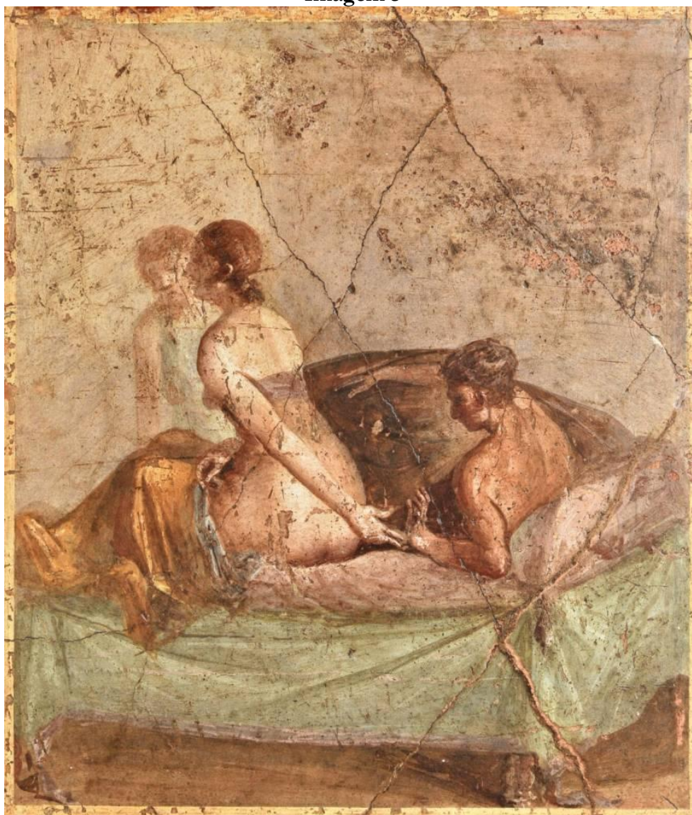
Cena erótica (séc. I). Afresco, Pompeia, Casa de Caecilius Iucundus. Gabinetto Segreto, Museo archeologico nazionale di napoli , inv. 110569.

O próprio imperador Augusto (63 a.C.-14 d.C.) já havia tentado moralizá-lo: refez leis relacionadas ao adultério, à sodomia, ao suborno e ao matrimônio entre pessoas de