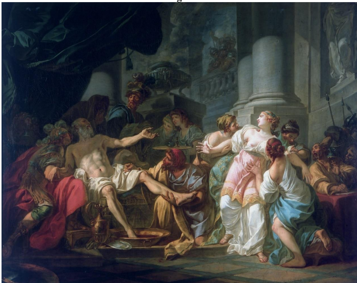
A morte de Sêneca (1773) de Jacques-Louis David (1748-1825). Óleo sobre tela, 123 x 160 cm, Musée du Petit-Palais, Paris, inv. PDUT1154. 96