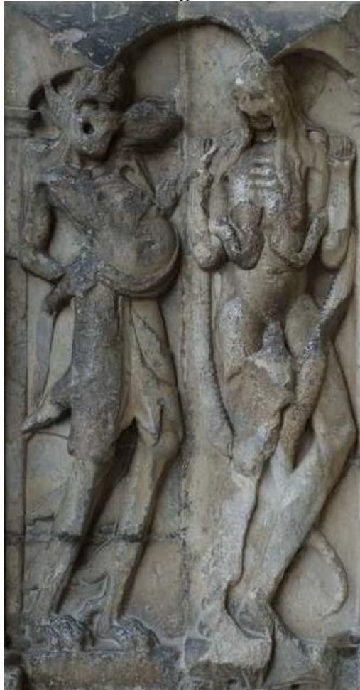
La lujuria y la avaricia, Pórtico de San Pedro de Moissac, Francia.