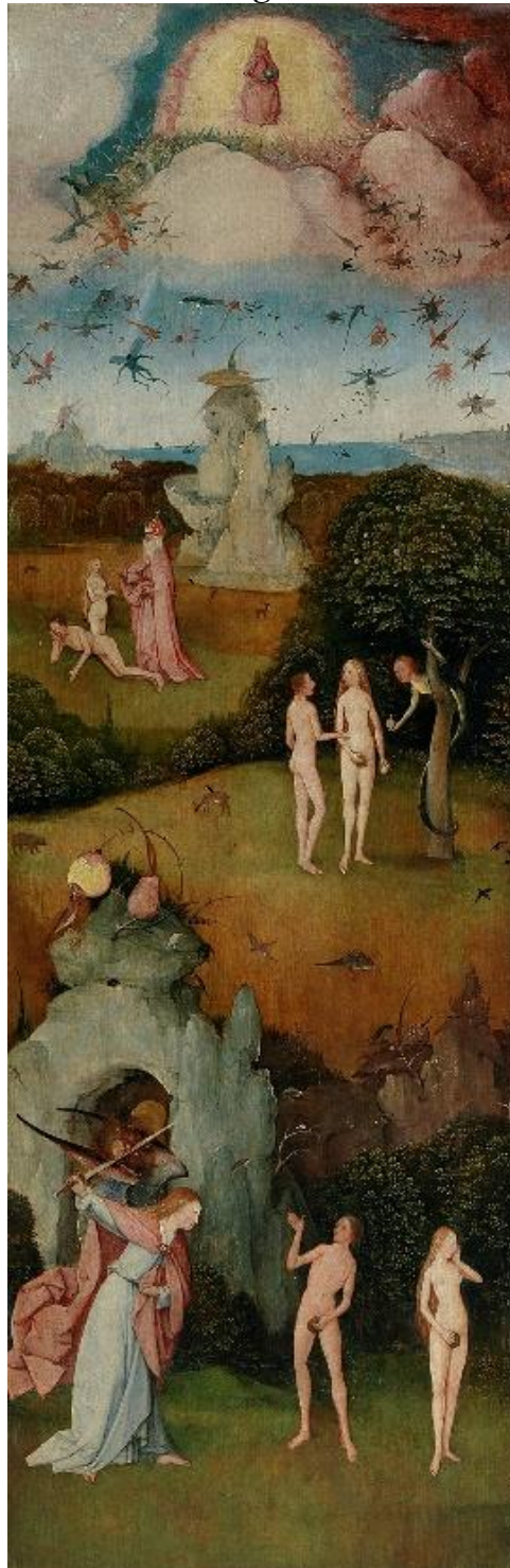
EL BOSCO. Detalle del panel izquierdo de El Carro de Heno (s. XVI), Museo del Prado, Madrid.