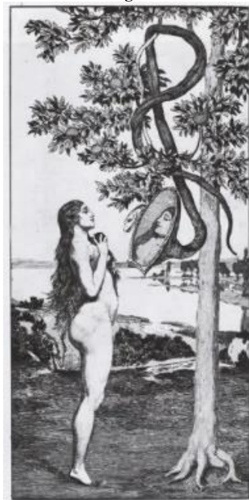
KLINGER, Max. Ciclo Eva y su futuro (s. XIX), grabado.