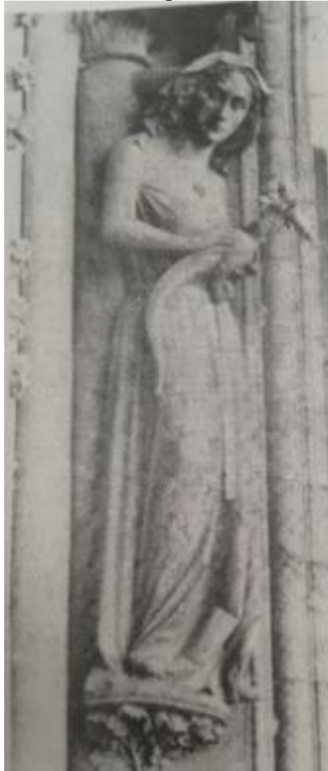
Eva acariciando a una serpiente (s. XIII), Catedral de Reims, Francia.

El contexto de renovación teológica y pastoral de los siglos XII y XIII se preocupa por definir y clasificar los pecados, que tendrán dos tipos de fuentes: ligados a la nueva labor pastoral, como manuales para la confesión y, por otra parte, los textos teológicos hechos más rigurosos siguiendo la metodología escolástica. Es ahora cuando el motivo iconográfico de la lujuriosa o mujer con serpientes alcanza un protagonismo destacado en la escultura románica. La sexualidad se convierte en uno de los problemas que más preocupa a la jerarquía eclesiástica, les preocupa las mujeres y que puedan ser objeto de tentación y causa de pecado. Al representar a la lujuria y la