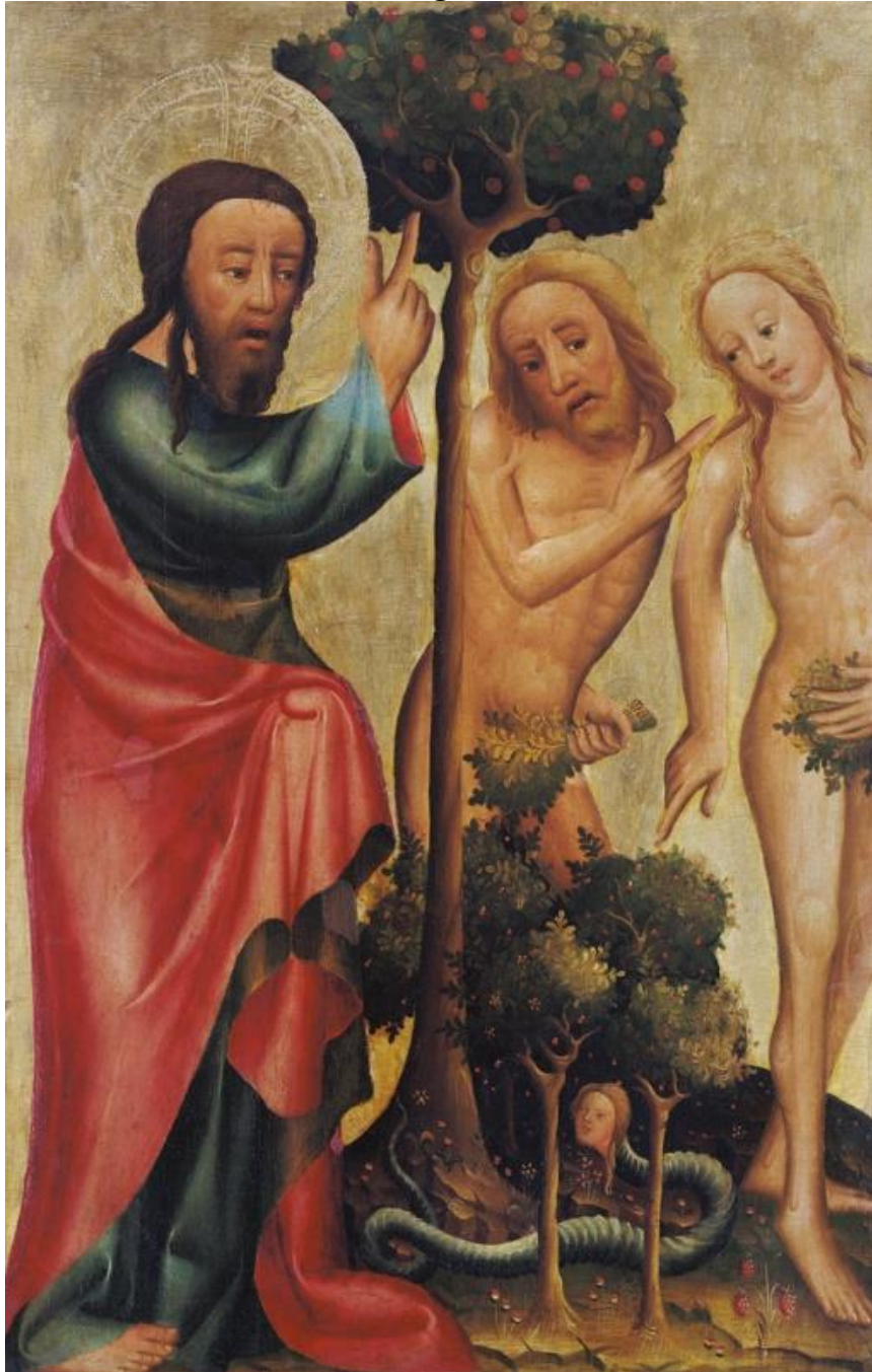
MAESTRO BELTRAM. Detalle del Retablo de Grabow (s. XIV). Kunsthalle, Hamburgo.