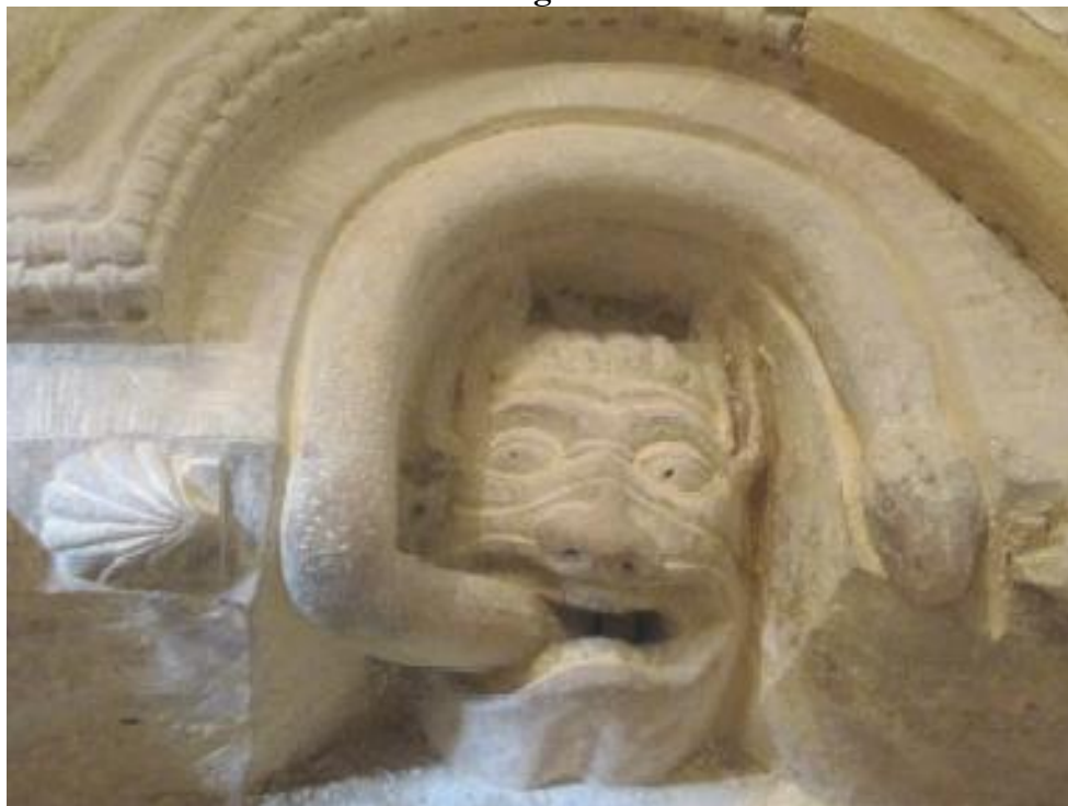
Serpiente saliendo de la boca de un demonio, Santa María de Siones, Siones, Burgos.