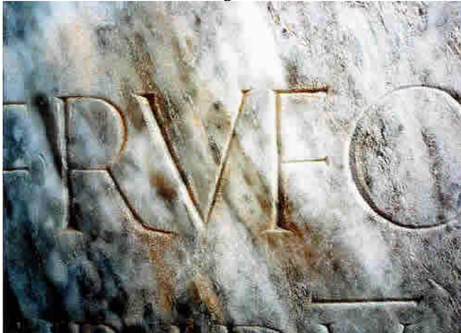
Particular da primeira linha: RUFO – com a cauda do “R” utilizando o espaço criado pela barra transversal esquerda do “U” seguinte.