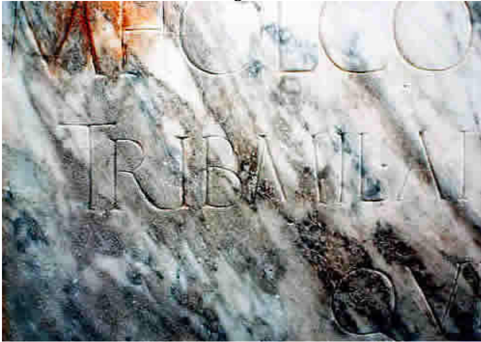
Particular da segunda linha: TRIB(UNO) – com o “R” “distante” do “I” seguinte.