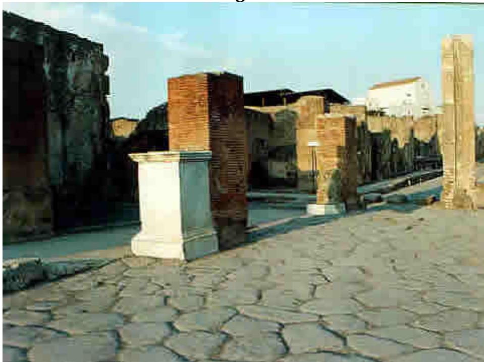
Base da estátua honorária de M. Holconius Rufus e logo atrás o pórtico dos Holcônios (Ianus Holconiorum).