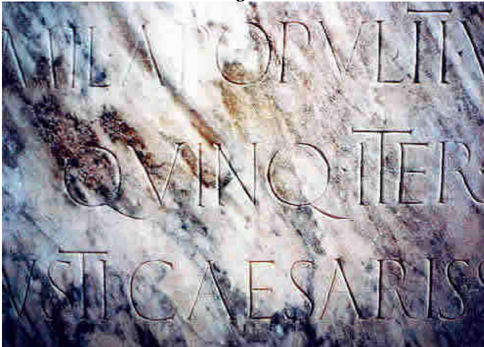
Particular da terceira linha: QUINQ(UENNALI).ITER(UM) – a) a cauda do primeiro “Q” ocupa o espaço criado pela barra transversal esquerda do “U” seguinte – b) sinal de separação triangular – c) o “T” de ITER(UM) mais alto que as outras letras.