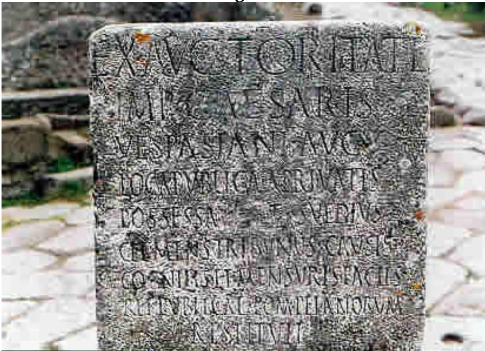
Epígrafe de T. Suedius Clemens fora da porta Vesúvio.