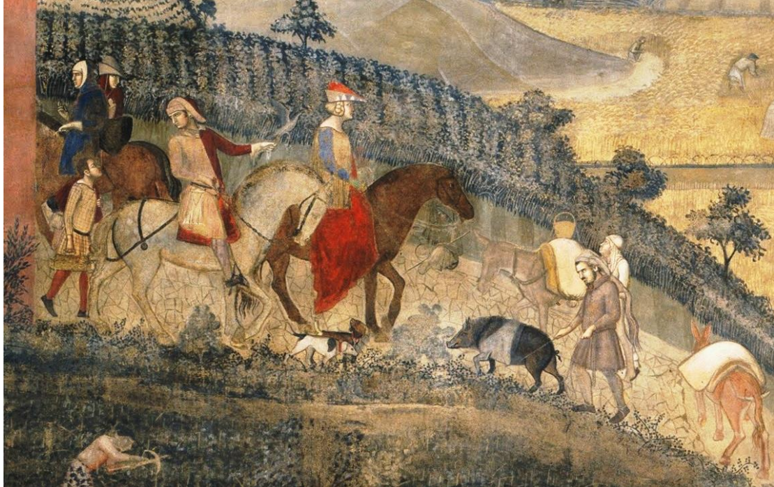
AMBROGIO LORENZETTI, Detalle de Los efectos del Buen Gobierno sobre el campo , 1338-1340. Palazzo Pubblico, Siena (detalle de Fig. 3).