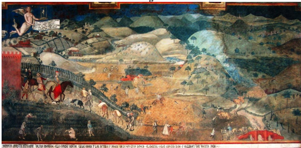
AMBROGIO LORENZETTI, Los efectos del Buen Gobierno sobre el campo , 1338-1340. Palazzo Pubblico, Siena

En esta risueña alegoría de la paz y el progreso agro-pecuario que el Buen Gobierno de Siena promueve en su campiña y en sus campesinos parece bastante palpable la huella de la exaltación bonaventuriana del mundo físico como vestigio y espejo de su divino Hacedor.