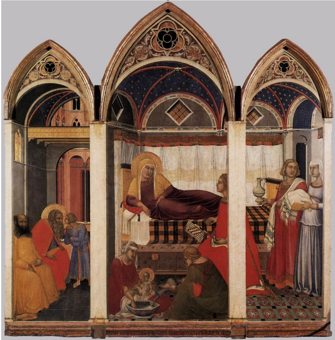
PIETRO LORENZETTI, El Nacimiento de María , 1342. Museo dell'Opera del Duomo, Siena.

Pietro Lorenzetti, en su Nacimiento de María , 1342, del Museo dell'Opera del Duomo en Siena, eleva al máximo nivel la valorización naturalista del mundo objetivo promovida por San Buenaventura. Este espléndido tríptico, en efecto, constituye un plexo de concordantes elementos de la más pura realidad. Así lo confirma, ante todo, la bien estructurada arquitectura de la casa, cuyos complejos espacios abovedados se yuxtaponen y concatenan en perfecta lógica constructiva, buscando en lo profundo otros espacios de mayor complejidad.