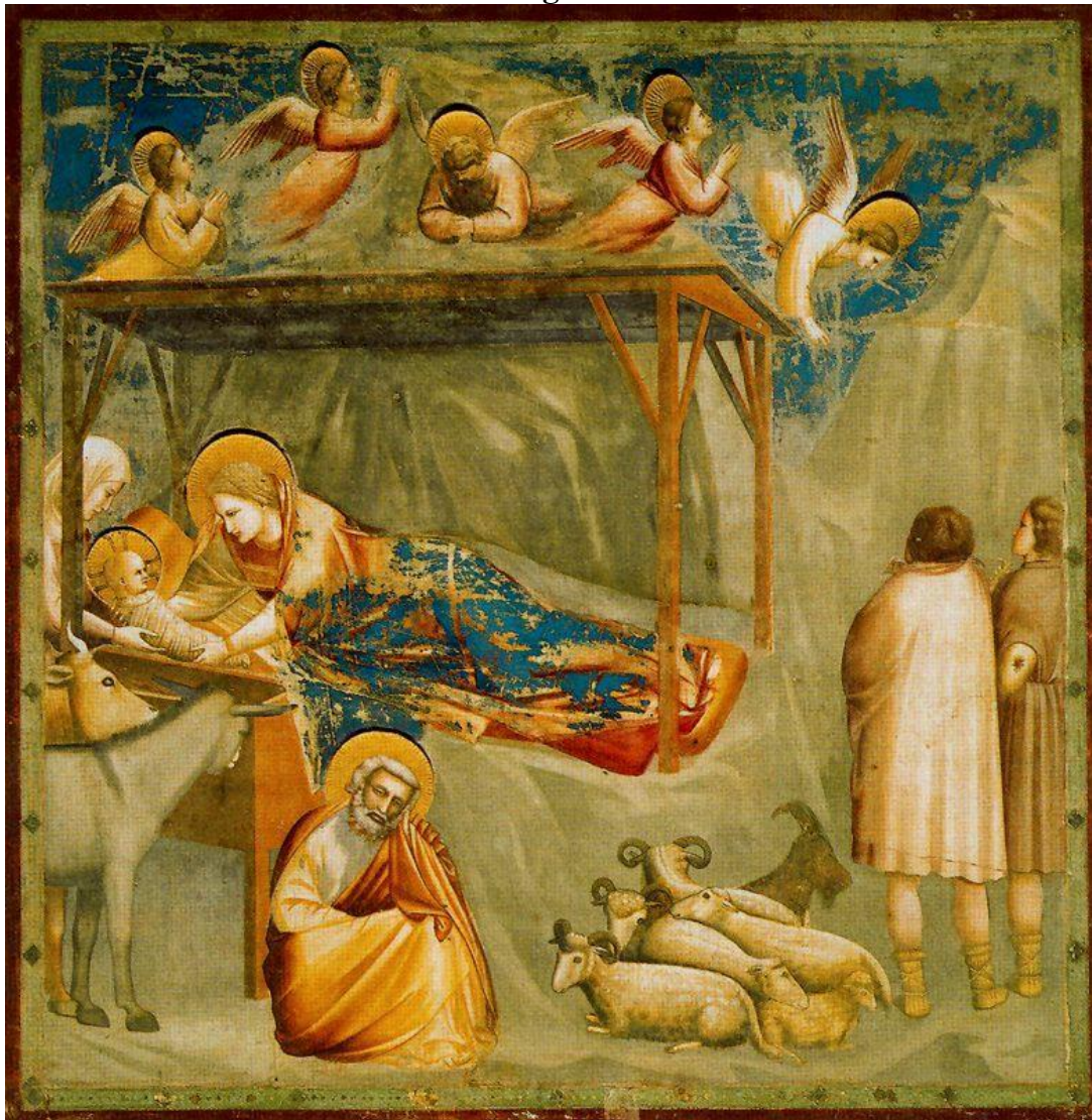
GIOTTO, La Natividad , 1302-1305. Capilla Scrovegni, Padua.

El enfoque “realista” se aprecia, sobre todo, en los seres humanos: la cotidianidad “realista” se manifiesta ya en la expectante actitud sorprendida de ambos pastores, que con su rústica indumentaria escuchan de espaldas al espectador el anuncio del ángel, o en la impasible somnolencia del sedente José, sosteniendo su cabeza sobre su brazo izquierdo a modo de almohada; sin embargo, ese “realismo” alcanza su cenit en la actitud maternal de la yacente Virgen en el momento de recibir en sus brazos al recién nacido, que, envuelto ya por entero entre fajas, le presenta una partera, inclinada con