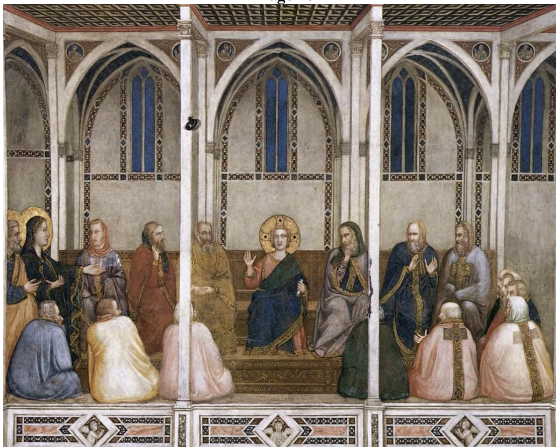
GIOTTO, Jesús entre los doctores del templo , c. 1315-1320, iglesia inferior, Basílica de San Francisco, Asís.

Giotto diseña la composición de Jesús entre los doctores del templo , c. 1315-1320, en la iglesia inferior de la Basílica de San Francisco en Asís, mediante la rítmica secuencia de elementos ternarios idénticos: tres asientos de mármoles policromos en primer plano, tres espacios artesonados en segundo término, tres arcos ojivos en el plano intermedio, tres bóvedas nerviadas en los últimos planos, tres ventanales bigeminados en la pared del fondo (más un cuarto inserto en el muro lateral).