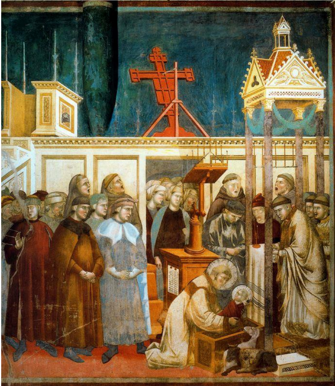
GIOTTO, La instauración del Pesebre en Greccio , c. 1297-1300, iglesia superior, Basílica de San Francisco, Asís.