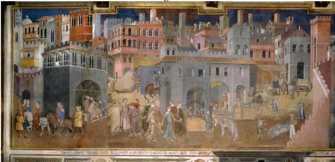
AMBROGIO LORENZETTI, Los efectos del Buen Gobierno en la ciudad , 1338-1340. Palazzo Pubblico, Siena.

La primera tesis parece reflejarla el artista al plasmar con evidente gozo las actitudes y acciones de los distintos estamentos sociales de Siena, desde los apuestos caballeros y damas de las clases privilegiadas que cabalgan sobre sus monturas o danzan en corro en los primeros planos, hasta los humildes artesanos y campesinos, entretenidos en ejecutar sus labores manuales o en arrear sus asnos y rebaños.