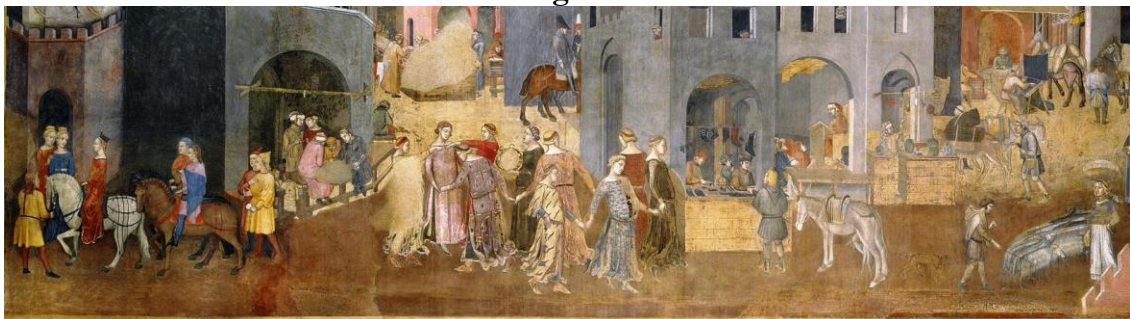
AMBROGIO LORENZETTI, Detalle de Los efectos del Buen Gobierno en la ciudad , 1338-1340. Palazzo Pubblico, Siena.

La segunda tesis bonaventuriana parece apreciarse en este fresco mediante la rítmica proporción numérica (armonía) con que el pintor plasma los