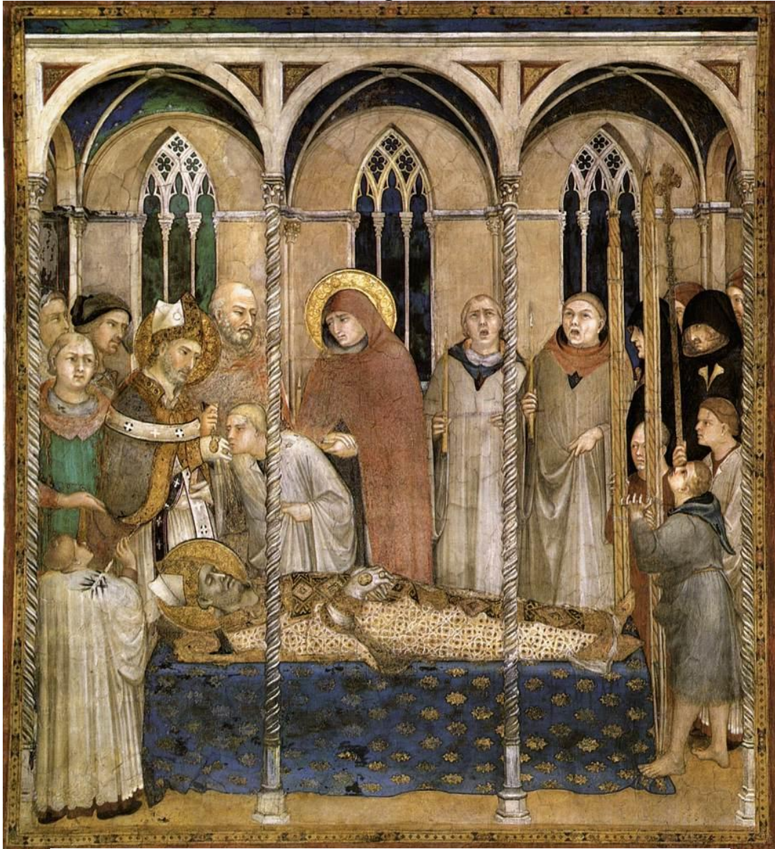
SIMONE MARTINI, Funeral de San Martín , 1313-1318, Capilla S. Martín, Capilla de S. Martín, iglesia baja, basílica de San Francisco, Asis.

Dentro de esa potente y armoniosa disposición matemático-geométrica, tan claramente bonaventuriana, Simone Martini inserta luego –reincidiendo aún más en la Estética del Seráfico– numerosos detalles de concluyente realismo en las figuras, poses, gestos y quehaceres de los personajes.