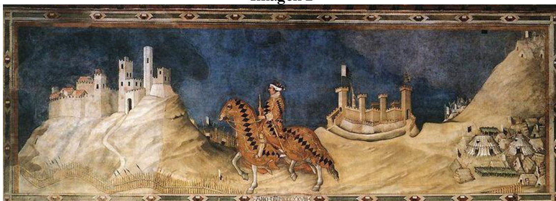
SIMONE MARTINI, Guidoriccio da Fogliano , 1328-1330. Palazzo Púbblico, Siena

Aunque muy distinto por su contenido narrativo a la recién analizada Natividad , el fresco Guidoriccio da Fogliano , 1328-1330 –pintado por Simone Martini en el Palazzo Púbblico de Siena para celebrar la conquista de los castillos Sassoforte y Montemassi por este condottiero al servicio de los sieneses–, manifiesta de análogo modo esa puesta en valor del mundo terreno impulsada por San Buenaventura.