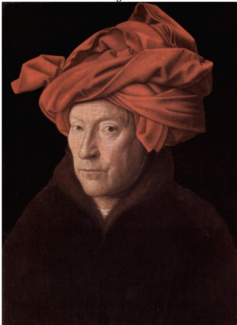
VAN EYCK, Hombre del turbante rojo , 1433, National Gallery, Londres.

Sobresale entre todo lo representado el turbante rojo que posee, tanto por su realidad en los pliegues, como por su vivo color, características deudoras de la utilización del óleo, algo que es novedad en la pintura flamenca. Aunque el fondo sea negro, la figura del retratado emerge de una manera muy notable, dándonos una sensación de naturalidad y de cercanía difícilmente conseguible en otros retratos ya vistos.