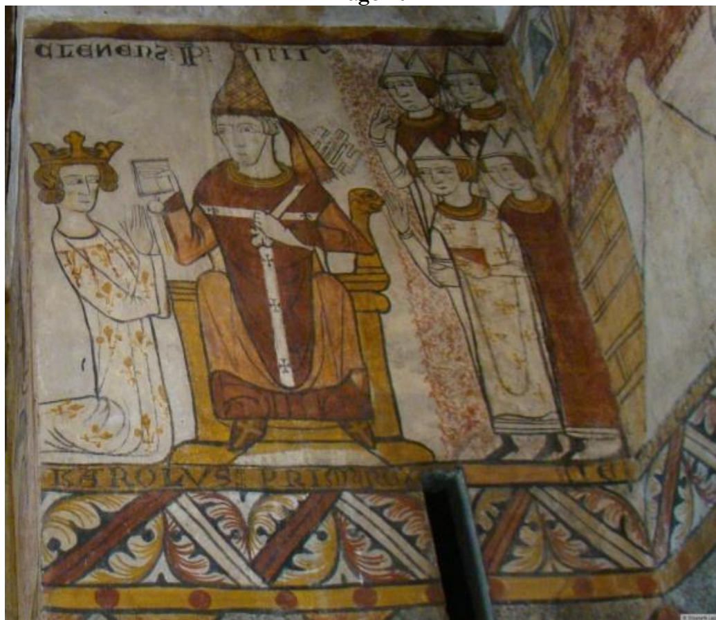
La investidura de Carlos de Anjou , pintura mural en la torre Ferrande, s. XIII, Castillo de Pernes, Francia.

En el mural La investidura de Carlos de Anjou en la torre Ferrande, del castillo de Pernes (s. XIII) [Imagen 7] se ven escenas de la vida cotidiana, como el combate ecuestre, y otras históricas, como la investidura de Carlos de Anjou por el papa Clemente IV (al que acompaña su corte). 27 No obstante, podemos ver que tanto su rostro como su cabello son puramente convencionales, y que su identificación proviene de la inscripción que vemos debajo.