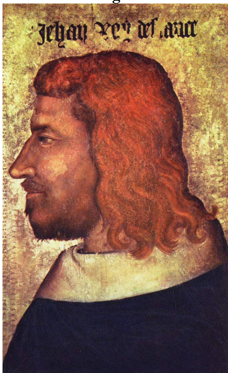
Retrato de Juan II, ca. 1350, Museo del Louvre, París.