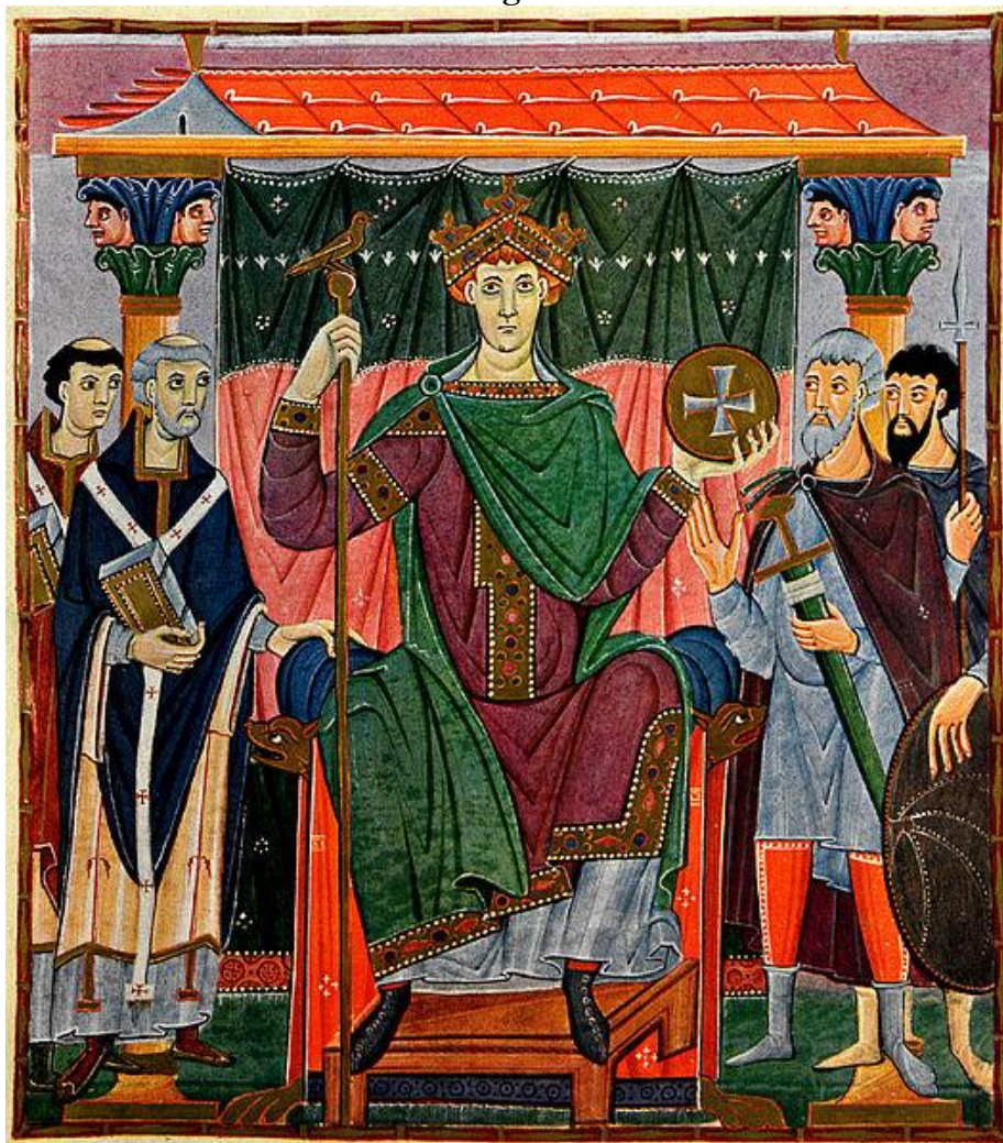
Otón III (Evangeliario de Otón III, MSS Clm 04453, ca. 990, Bayerische Staatsbibliothek, Munich).

Esto llega a tal punto que su sucesor, Otón III [Imagen 3] aparece en otra miniatura en el Evangeliario que se conserva en la Biblioteca de Munich en un ambiente idéntico, solo cambiando a los personajes. Así, la pintura de este momento refleja más que individuos, tipos, personajes idénticos que nos permiten aseverar que “nunca fue mejor ilustrado el dicho de que todos somos iguales ante la muerte” 20 .