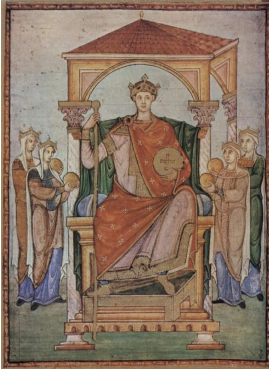
MAESTRO DEL REGISTRUM GREGORII, El emperador Otón II rodeado de las provincias del Imperio , ca. 984, Museo Condé, Chantilly.

La miniatura El emperador Otón II rodeado de las provincias del Imperio [Imagen 2], hecha por el Maestro del Registrum Gregorii hacia 984, nos muestra a un Otón II en la ejecución de todo su poder, portando varios instrumentos de mando, sentado sobre trono y bajo un baldaquino. Como vemos, la escenografía de poder no puede estar más clara. Se cree que el manuscrito del