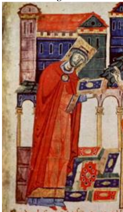
Imagen 4. El abad Desiderio ofreciendo la iglesia a Dios , ca. 1071-1087, Iglesia de Sant'Angelo in Formis, Italia; imagen 5. Desiderio de Montecassino , Codex Vaticanus Latinus 1202, s. XI, Biblioteca Apostólica Vaticana, Ciudad del Vaticano.

En el fresco El abad Desiderio ofreciendo la iglesia a Dios en Sant'Angelo in Formis [Imagen 4] se ve a este abad, quien fue precisamente el que reconstruyó en el siglo XII este conjunto originario del siglo VI con formas arquitectónicas muy parecidas a las del modelo vaticano, momento en el que decide ornamentarla al modo bizantino. Tiene el nimbo cuadrado que la iconografía bizantina reservaba a los vivos, y como ya vimos, sostiene en sus manos la maqueta de la iglesia. Las fuentes 21 aseguran que el retrato es auténtico, puesto que ofrece similitudes en gesto, silueta, rostro regular con barba rara y bucles en la cabellera con otra representación en la que aparece en el segundo folio del Leccionario de Montecassino , hecho en la misma época y conservado en la Biblioteca Apostólica Vaticana [Imagen 5].