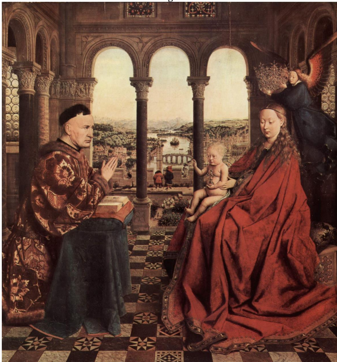
VAN EYCK, La Virgen del canciller Rolin , 1435, Museo del Louvre, París.

Caso muy interesante es El hombre del turbante rojo , 1433, de Jan van Eyck, [Imagen 10]. La pintura flamenca es una pintura de mirada, y se suele decir que este es el primer retrato de la tradición flamenca que nos mira directamente a los ojos, rasgo que en los siglos siguientes se convertirá en característica distintiva del autorretrato. Por ello, muchos historiadores han querido identificar esta pintura como el autorretrato del pintor.