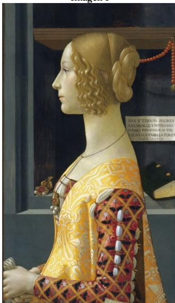
D. GHIRLANDAIO, Retrato de Giovanna Tornabuoni , 1488, Museo Thyssen-Bornemisza, Madrid.