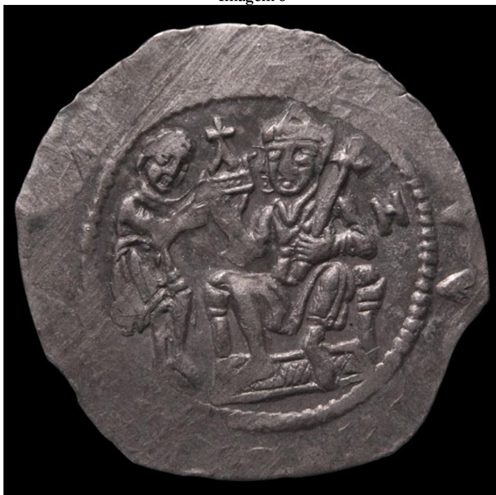
Denário emitido por Vladislav II, representando sua coroação por Frederico I Barbarossa . 36