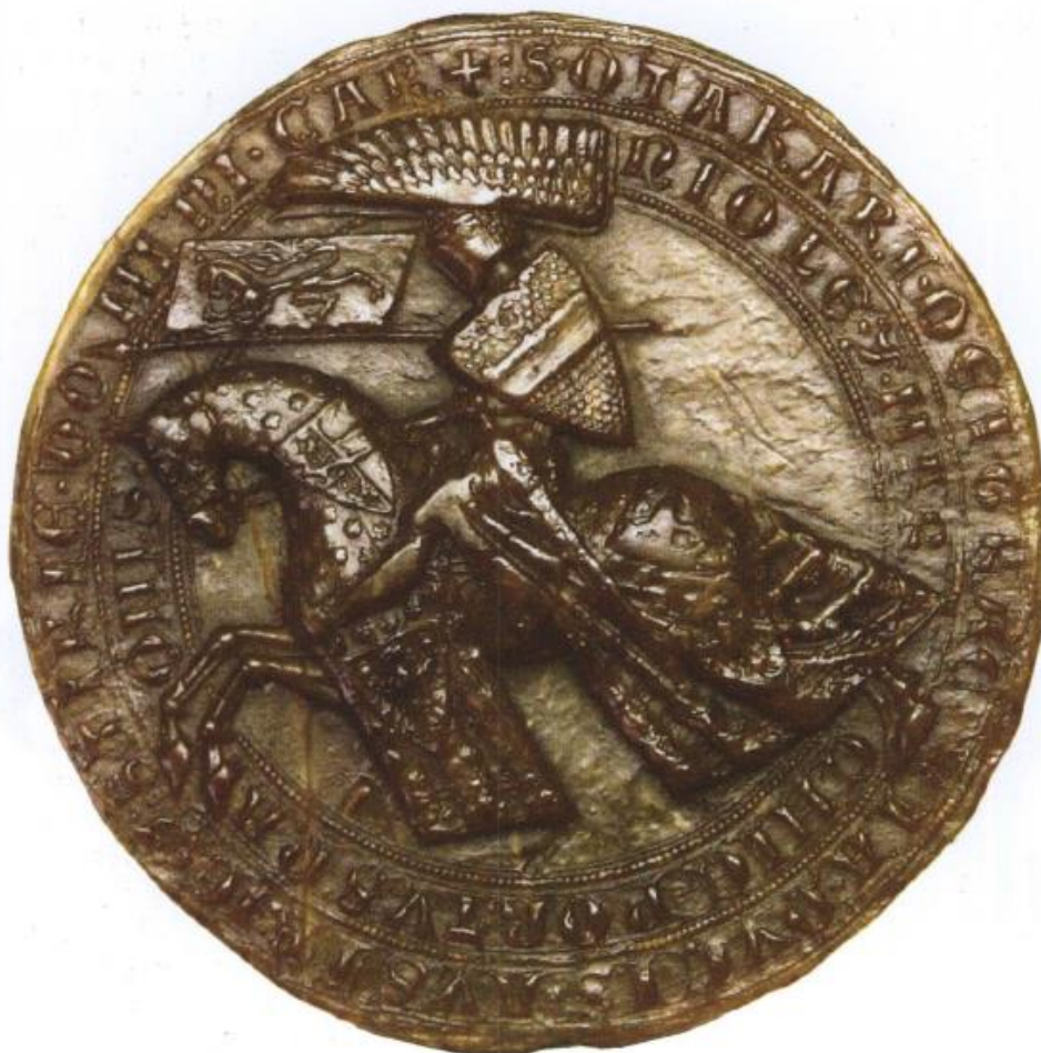
Verso do selo régio de Přemysl Otakar II. 45

Este exemplar magnificamente preservado demonstra mais do que a adoção de dispositivos heráldicos como forma de auto-representação iconográfica, ligada aos domínios do monarca: o vexillum da lança deixa de lado a águia de São Václav (ainda presente no escudo de Václav I) e adota o leão rampante de dupla cauda, representativo da Boêmia e, na caparison que recobre o cavalo, se encontram um escudo com uma águia, que tanto pode representar o escudo de São Václav, quanto pode representar o brasão adotado para a Morávia.