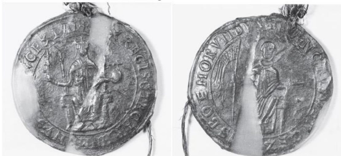
Anverso e verso do selo de Přemysl Otakar I. 41

As relações entre eslavos e germânicos se tornaram cada vez mais complexas e mesmo paradoxais: os boêmios mantinham atitudes ambivalentes perante seus vizinhos mais poderosos. Em questões políticas e culturais eles frequentemente buscavam emular os padrões dos forasteiros. Contudo, simultaneamente, os boêmios se ressentiam de sua prosperidade e realizações, especialmente quando os germânicos passaram a receber favores especiais dos reis tchecos.