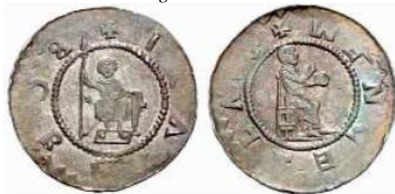
Denário emitido por Bořivoj. 35

Ao mesmo tempo em que as representações ducais se consolidaram nestas linhas, foi adotada a presença, no verso das moedas, de representações de São Václav (o martirizado duque Přemislida que governou entre 921 e 935), cujos atributos iconográficos são justamente a lança com vexillum (com uma águia estampada) e escudo, que passou também a ser representado entronizado. Fica clara a intenção dos duques boêmios de associar suas pessoas tanto às percepções ligadas à realeza quanto às ligadas à santidade de um ancestral direto, ampliando assim o escopo simbólico do ofício ducal.