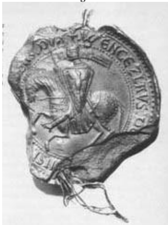
Anverso do selo de Václav I. 44

Tal medida se coaduna perfeitamente com o fato de que Václav I foi um grande incentivador da importação da cultura cavaleiresca germânica para a corte de Praga, tendo convidado muitos letrados germânicos, incluindo o minnesinger Reinmar von Zweten (também arrolado no Codex Manesse ) na qualidade de seu poeta de corte.