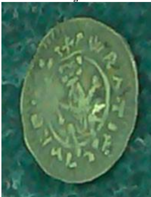
Denário de prata emitido por Vratislav II. 34

Vratislav não foi passivamente recordado como rei, como demonstrado nos afrescos de Znojmo: ele propagou ativamente sua imagem como tal em suas emissões monetárias que, lembremos, eram as únicas que circulavam em seus domínios, propagando a toda população o seu novo status.