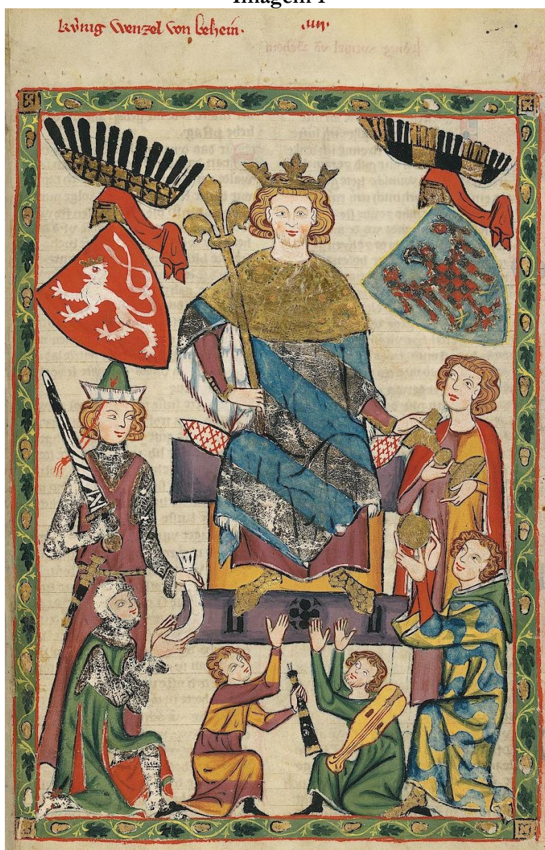
Václav II, Codex Palatinus Germanicus 848, fl.10r 5