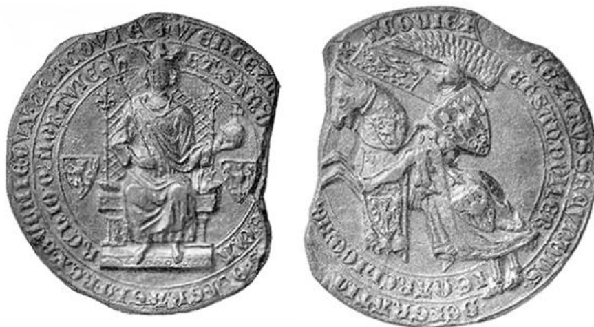
Anverso e reverso do selo régio de Václav II. 10