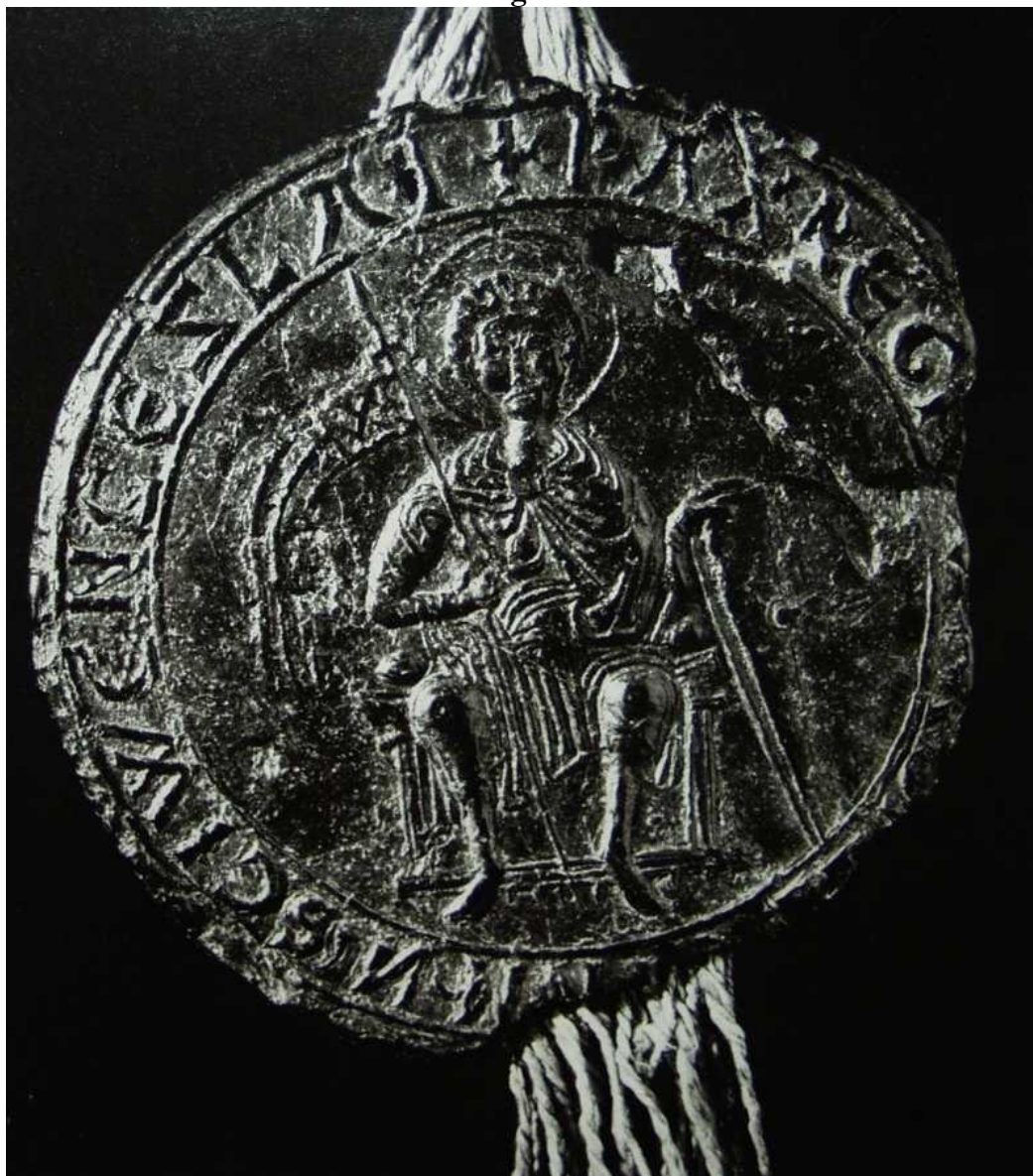
São Václav entronizado no verso do selo de Vladislav II. 37