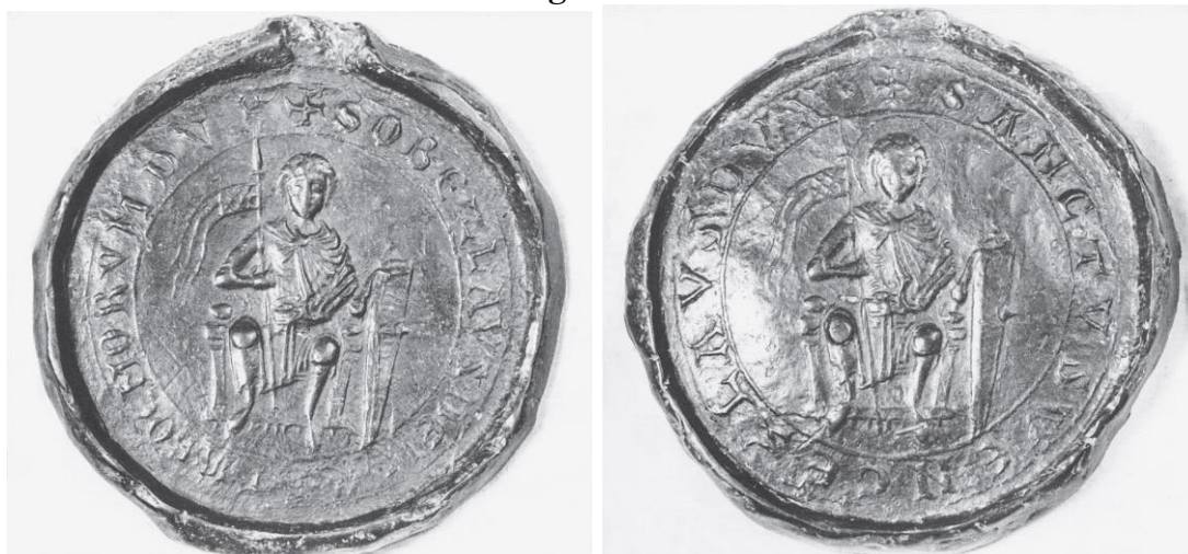
Anverso e verso do selo de Soběslav II. 40

O grande desvio neste padrão ocorreu durante a tenência ducal de Jindřich, bispo de Praga entre 1182 e 1197 e, entre 1193 e 1197, simultaneamente duque da Boêmia. Suas emissões monetárias apresentam padrões iconográficos diferenciados: elas o mostram com os aparatos episcopais tradicionais, portando pálio e mitra. Em duas destas emissões, Jindřich porta um báculo em sua mão esquerda e uma lança com vexillum na direita.