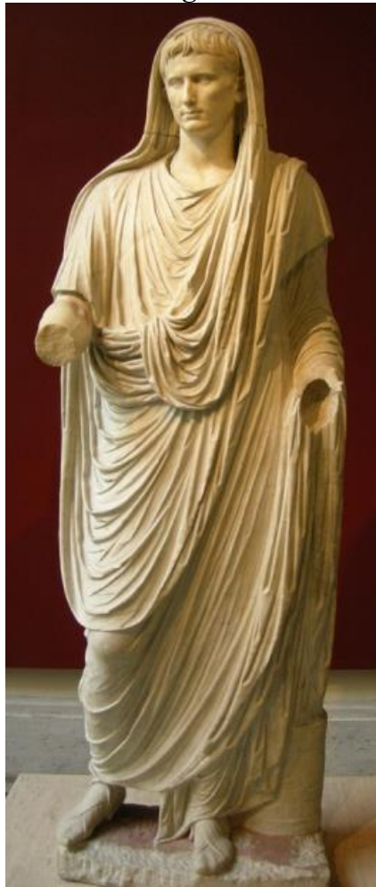
Augusto da Via Labicana, Museu Nacional de Roma.