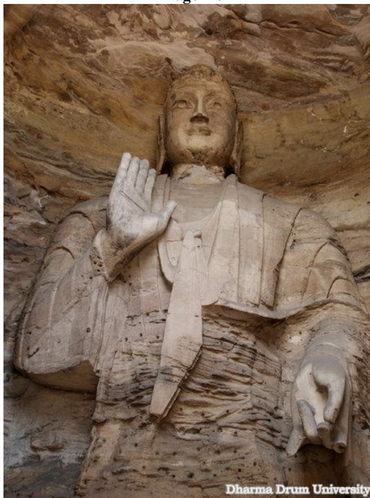
Detalhe da vestimenta do Buda Akshobhya.