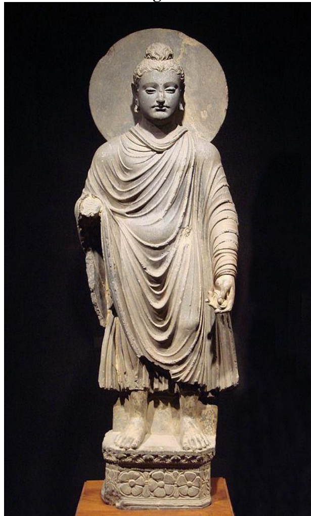
Buda em pé de Gandhara, Museu de Tóquio.

http://upload.wikimedia.org/wikipedia/commons/b/b8/Gandhara_Buddha_%28tnm%29.jpeg