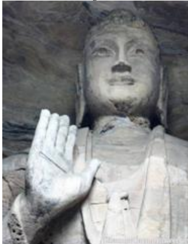
Detalhe da face do Buda Akshobhya.

Institutional University Repository, Taiwan University, 2011