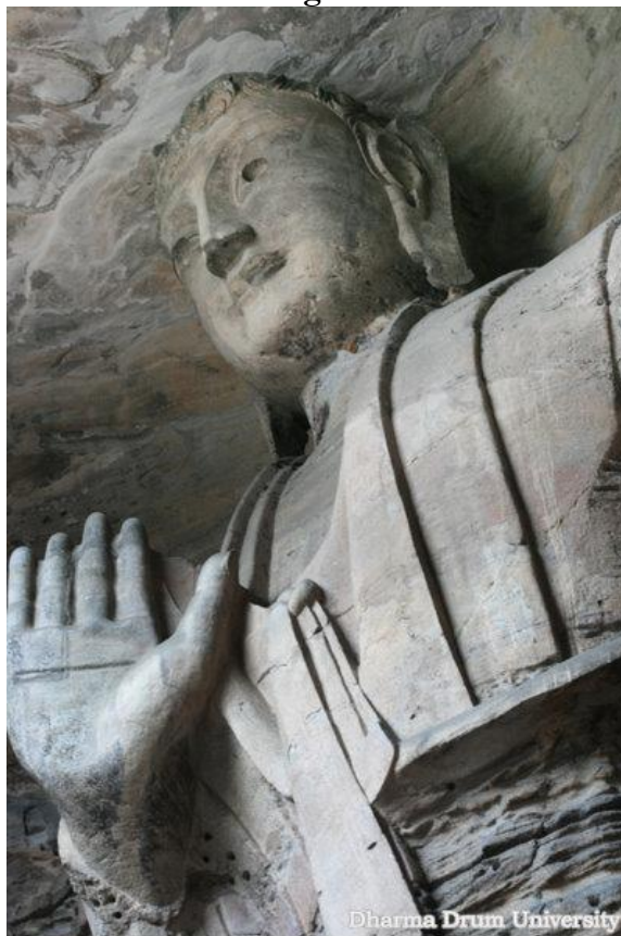
Idem Imagem 2, visto por outro ângulo.

O detalhe da vestimenta do Buda aqui também merece destaque: essa é a única estátua em todo o complexo no qual está representada uma forma diferente de posicionar o Samghati (o manto do monge) em relação ao corpo. Mizuno 19 não teve receio de afirmar que esse seria um “estilo de vestimenta ocidental”, embora apontasse igualmente que a estátua estaria com uma “vestimenta chinesa” por baixo, o que não fica evidente. 20